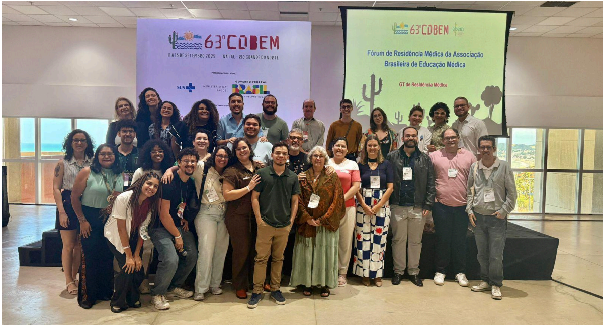
Participantes do Fórum de Residência Médica no 63º COBEM